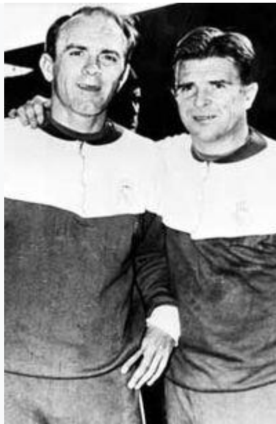
Alfredo Di Stéfano és Puskás Ferenc

Puskás eltöltése ekkorra véget ért, és a Real időközben megszerezte sorozatban a harmadik győzelmét is az akkoriban létrejött UEFA Bajnokcsapatok Európa-kupájában, így Kocsis Sándorhoz és Czibor Zoltánhoz hasonlóan Puskás is Spanyolországba költözött. Rövidesen barátságot kötött Alfredo Di Stéfanoval, és közös munkájuk révén a Real Madrid a legjobb európai futballklubbá vált. Hatszor nyerték meg a nemzeti bajnokságot, és további három alkalommal hódították el a Bajnokcsapatok Európa-kupáját.